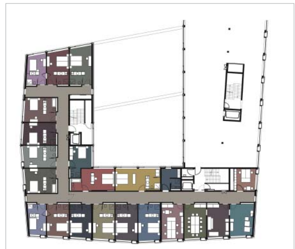
Korridorfluchten werden durch eine Abfolge von «Lichtinseln» gegliedert, den geräumigen Zimmern verhelfen farbige Decken zu einer individuellen Raumstimmung.

Auf das erste Bedürfnis wurde reagiert, indem man die langen Gänge mit Nischen bei den Zimmertüren versah und die Deckenpartien dieser Nischen als Leuchtflächen ausbildete. Durch diese Massnahme werden einerseits die langen Gangfluchten rhythmisiert und optisch verkürzt und andererseits für sehbehinderte Gäste die Zimmereingänge durch das Anstrahlen der Türflächen deutlicher kenntlich gemacht. Unterstützend zur Auf-