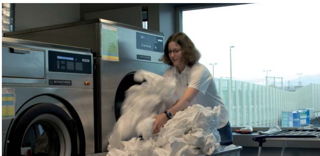
Saubere Sache: Eine Mitarbeiterin füllt in der Lingerie die Waschmaschine.

Es ist halb sieben Uhr am Morgen. Mit geübten Handgriffen bereiten die Mitarbeiter in der Lobby weitgehend selbstständig das Frühstücksbuffet vor. Hier nehmen zwischen 7 und 10 Uhr die Hotelgäste das Frühstück ein. Die Käse- und Fleischplatten werden sorgsam dekoriert, frische Früchte werden geschnitten und angerichtet, Wasser kocht, Speckscheiben und Würstchen brutzeln auf dem Küchenherd. Jeder Mitarbeiter kennt die Liste der zu bewältigenden Auf-