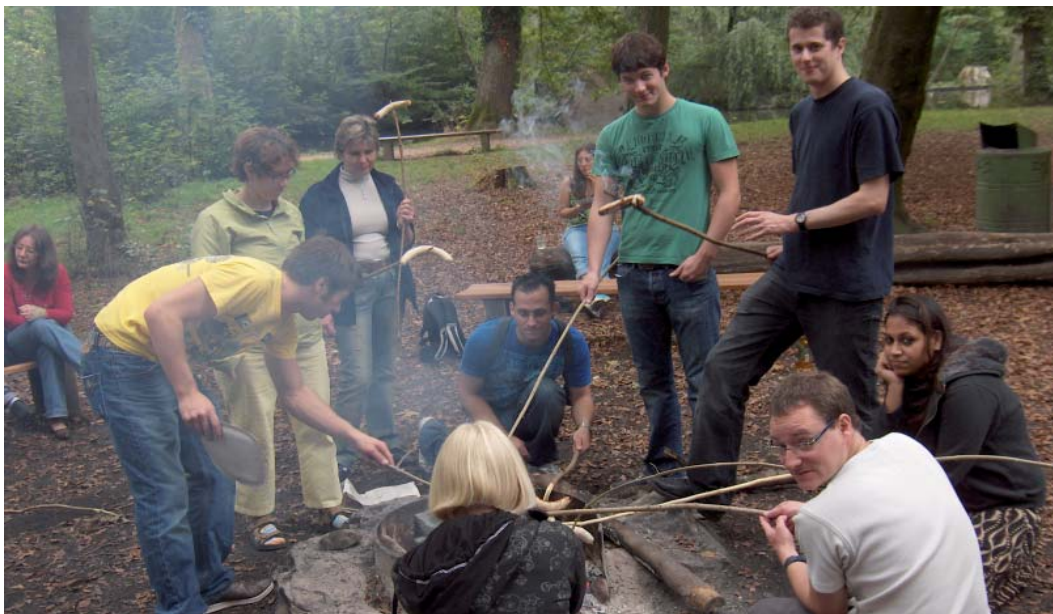
Geselligkeit und Feuer: Beim Mitarbeiteranlass geht es um die Wurst.

Im Sinne des Normalisierungsprinzips ist die Hotelleitung darauf bedacht, die Zusammenarbeit und die Kommunikation zwischen dem Führungsteam und den Mitarbeitern möglichst barrierefrei und gemeinschaftlich zu gestalten. Daher auch die für ein Hotel zunächst vielleicht ungewohnte gemeinsamen Pause in der Lobby, sobald die Hotelgäste ihr Frühstück beendet und das Haus verlassen haben. Zur Pflege des Teamgeistes gehören auch Ausflüge zu Sport- oder kulturellen Anlässen oder Grillabende