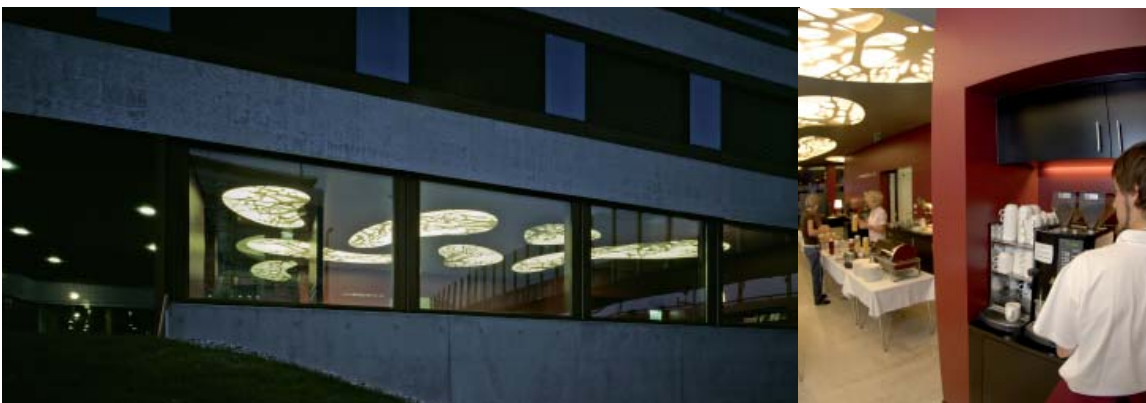
Breite bei Nacht: Das Hotel schläft nie. Und das nächste Frühstück kommt bestimmt.

Sozialversicherung (BSV) über die Pläne informiert, welches ein Jahr später das Projekt guthiess. So konnte es als „geschützte Werkstatt“ in die kantonale Bedarfsplanung einbezogen werden. Für die Planungsphase sicherte zudem die GGG finanzielle